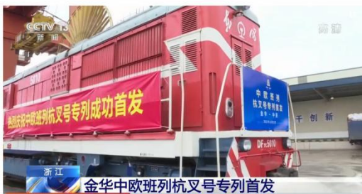
“义新欧”中欧班列“杭叉号”专列首发！

在目前的行情下，业内危机四伏，如何逆势增长，十分考验各家叉车制造企业的功力，而杭叉近几年实现从规模到盈利的全面提升，群英荟萃，尽展杭叉风采。