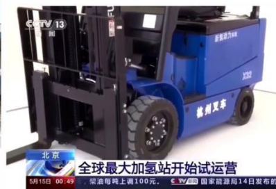
杭叉集团与天津新氢动力合作研发的氢燃料电池叉车首次亮相北京大兴氢能国际展示中心