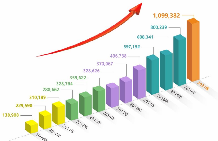
中国工业车辆行业年度总销量趋势图（台）