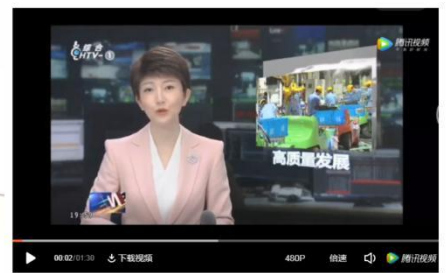
《杭州新闻》杭州制造业高质量发展领跑全省：勇于创新、不满足于“跑量”